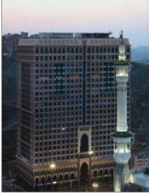
Mekke Intercontinental Oteli